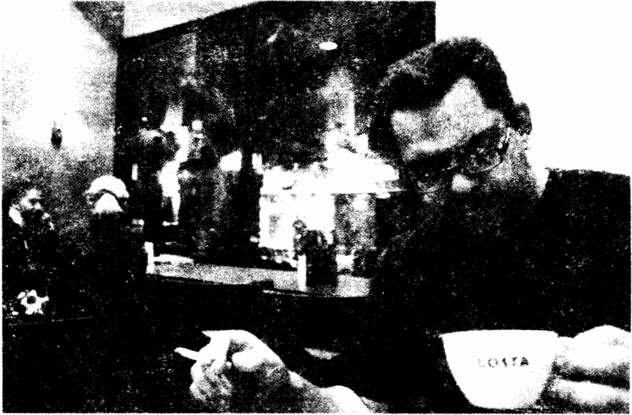
مقهى كوستا، بالزمالك

من غير صوت، وقدمت أغنيات شعبية عربية وغربية رائجة خلفية موسيقية بديلة. ومعظم زياراتي لمقهى سبكترا كان في أوقات النهار أو في بواكير المساء لأقابل واحدة من صديقاتي أو معارفي. ورغم اتساع المقهى، فلطالما تعين علينا أن ننتظر بالخارج حتى تخلو إحدى الطاولات. كنا نختار طاولة في مقدمة المقهى ونطلب سلطة أو ساندويتش. وقد اشتهر سبكترا بأنه يقدم طعاماً طيباً ورخيصاً نسبياً. وكانت قائمة الطعام تتألف من تشكيلة واسعة من البيرغر والسلطات والساندويتشات بما في ذلك سلطة سيزار وكلوب ساندويتش اللذان يكاد لا يخلو منهما مكان كهذا. وفي الأمسيات كانت الغرفة الخلفية تكتظ بزحام من شباب أصغر سنّاً جاء بالأساس للتفاعل الاجتماعي في شغل مختلطة الجندر.