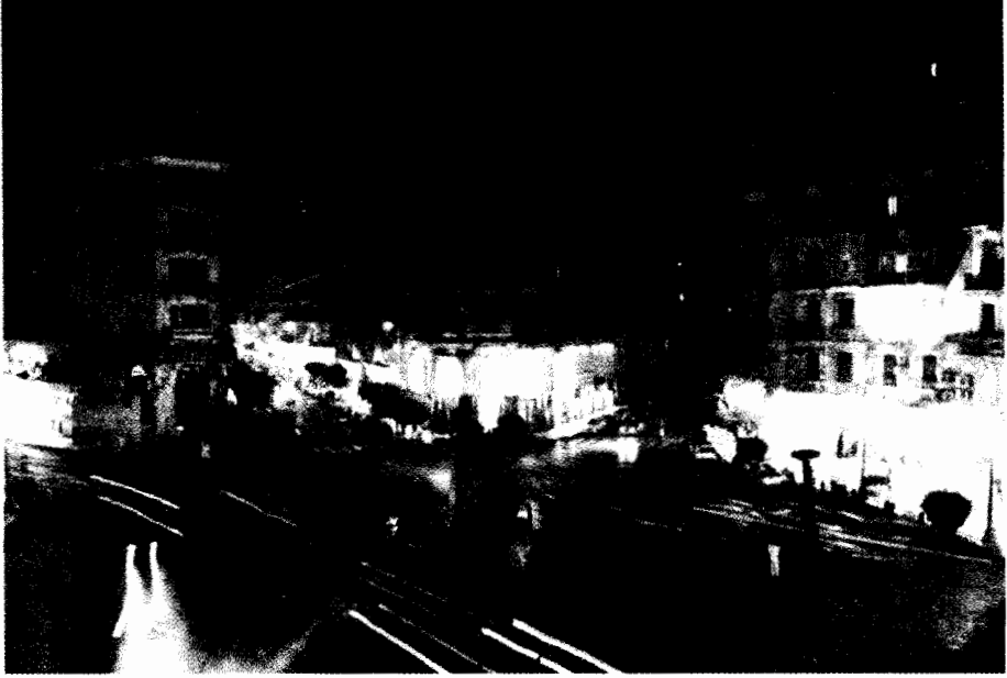
صورة ميدان طلعت حرب بوسط القاهرة.