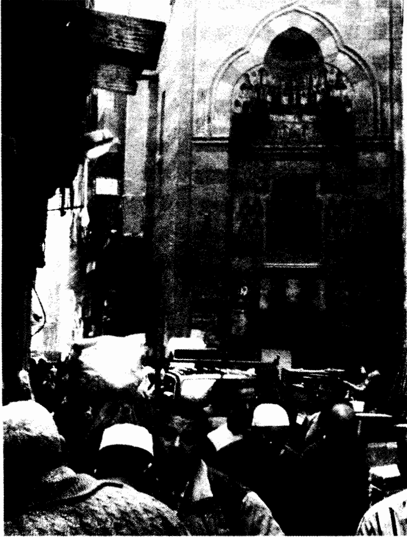
صورة: شارع الغورية بالقاهرة الفاطمية

والأحياء الحصرية المغلقة في الصحراء المحيطة بالقاهرة (١٧) هي التعبيرات الأكثر وضوحاً عن الحقبة الليبرالية الجديدة في مصر. فهذه المجتمعات المغلقة - الكومباوندات بالتعبير المحلي - هي وعد بحدائق خضراء مورقة ومساكن مضيئة