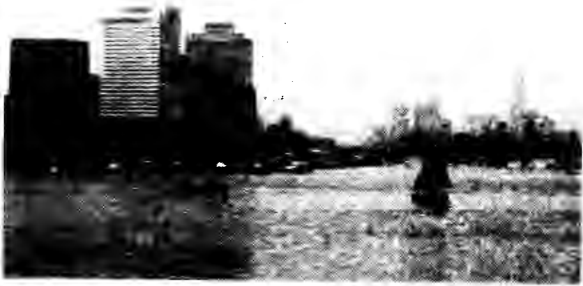
صورة القاهرة على ضفاف النيل