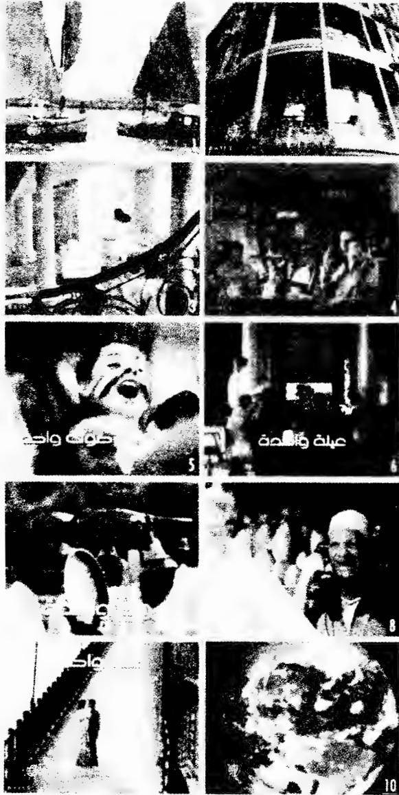
صور ثابتة من إعلان المصرية للاتصالات، إنتاج بيتسى إكويتي http://www.batesequity.com/web/index.html (أخذت في ١٩ فبراير ٢٠٠٥)