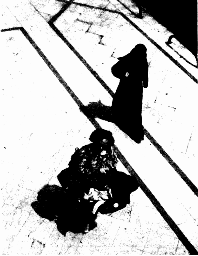
امراتان فى شارع جامعة الدول العربية

وقد كانت مواصفات الزوجة المثالية المنتمية للطبقة المتوسطة العليا موضع مناقشات ساخنة. فمع انتشار أساليب الحياة الكوزموبوليتانية الصارخة بين نساء الطبقة المتوسطة العليا فى سن الزواج فإن أشكالاً من التدين والحشمة ذات الطابع الطبقي كانت مصدراً لنماذج مجندرة مختلفة وإن تميزت بقدر مماثل من الجاذبية