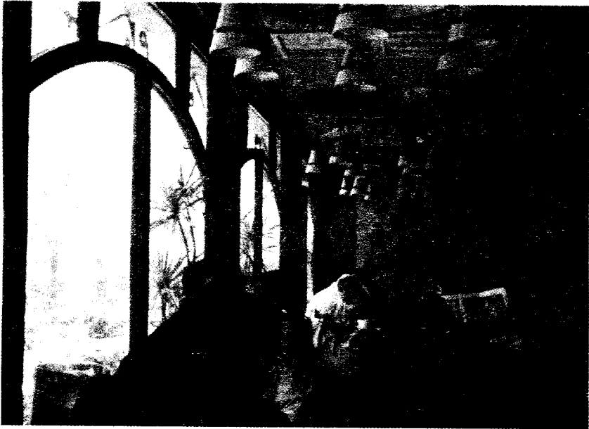
قهوة تريانون بالهندسين