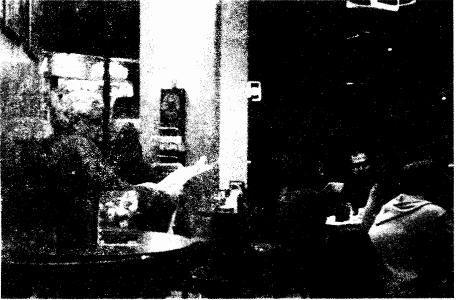
رواد مقهى كوستا بالزمالك

الكافية لات بأنه " إكسبريسو تمت تهدئته بدفقة سخية من اللبن المبخر المتوج بهمسة من الطيب المزيد ". واستخدام الإنكليزية وادعاءات العلاقات المباشرة أو غير المباشرة بالنظائر في أمريكا يضيف إحساساً بالكوزموبوليتانية والحصرية على المكان وما فيه من طعام ومشروبات وزبائن. وبالتوافق مع قائمة الطعام فإن اللغة المستخدمة في مجال الكوفي شوب هي خلطة الطبقة المتوسطة العليا العربية - الإنكليزية المميزة للمهنيين الشبان من الطبقة المتوسطة العليا. وهذا ينسجم، بشكل لطيف، مع الديكور وقائمة الطعام الكوزموبوليتانيين.