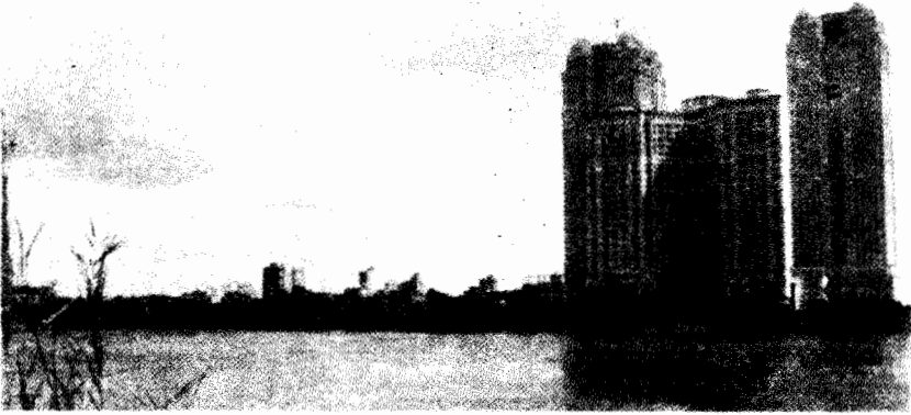
أبراج نايلى سىتى

هذه التماثلات فى المشاهد الحضرية حول العالم تفصح عن نشوء دائرة من الفضاءات العولية المترابطة والموجودة داخل محيط غالباً ما يكون مدقماً ويتزايد تهميشه. وتدفع ساسكيا ساسن (٢٠٠٠ - ٢٠٠١) بأن المدن اكتسبت أهميتها باعتبارها مفاصل التنسيق والسيطرة للإنتاج العولى المنتشر. فهى تقوى تجسّدات العولة التى يتزايد انفصالها عن بقية المشهد الحضري. وهذه المركزية (المتصورة) للمدن خلقت ديناميتها الخاصة. ويدفع روبنسون بأن "المدينة العولية" قد ترجمت إلى "خرافة تنظيمية" تعد بثورة حضرية جديدة، وتهدد بانفصال شامل (٢٠٠٢، م ب سميث ٢٠٠١) ويدفع نيل سميث بأن تركيز الإنتاج على الصعيد المتروبولي (Metropolitan) المتصل بالعاصمة أو الخاص بها) نشأت عنه حضرية جديدة (٢٠٠٢: ٤٣٤).