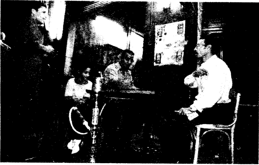
قهوة بلدى - باب اللوق