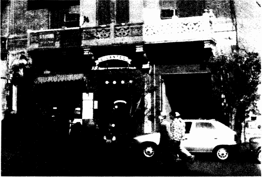
مقهى سيلانثرو بوسط القاهرة

الطبقة المتوسطة العليا لجهة الأسلوب ويعتبرون من " مستوى اجتماعي " أدنى. وقد يكون اللفظ الأقدر على توضيح مغزى هذا المصطلح هو " سوقى ". وبعكس شعبي أو بلدى فإن مصطلح " بيئة " لا يشير إلى الطبقات الأدنى أو إلى ما يفترض أنه عاداتهم بل إلى طبقة متوسطة " فاشلة " (٤٤). ويعكس الانتقال من بلدى إلى بيئة انتقال الصراع الرمزي من موقع على الحدود بين " الطبقة المتوسطة المتعلمة " و " الطبقات الدنيا الفظة " إلى خطوط التقسيم داخل الطبقة المتوسطة ذاتها. فقد حلت تقسيمات أكثر مراوغة محل التمييزات الجلية والواثقة التي تقوم على ارتباط بين الطبقة والثقافة التي تنطوي عليها ثنائية " بلدى " ونقيضه " شيك " أو " مستوى "، ضمن زخم عالى التوتر من الأذواق والأساليب.