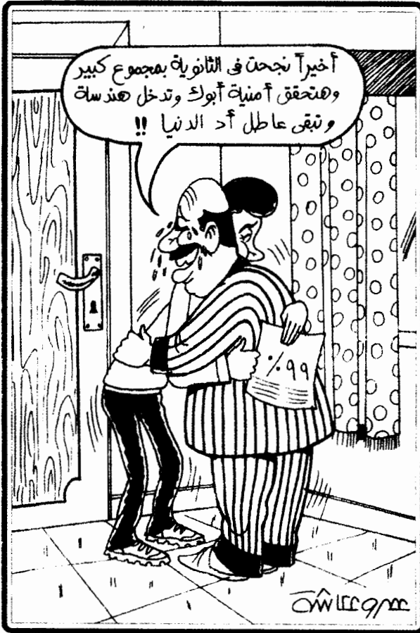
رسم الكاريكاتير عمرو عكاشة، الوفد، ٢١ يوليو ٢٠٠٤

مجموع الدرجات المطلوب بعد اجتياز الامتحانات العامة لدخول الجامعات الحكومية يرتفع عاماً بعد عام للحد من عدد الملتحقين بالجامعات التي تكثرت بالطلاب. ووصل الأمر بكليات القمة مثل الطب والهندسة أنها أصبحت تطلب الحصول على ما يقارب مائة بالمائة، وأصبحت درجات الطلاب في الامتحانات المركزية تعتمد بشكل جزئي، على جودة التعليم الذي يتم الحصول عليه وعلى الإنفاق على الدروس الخاصة. وهكذا فقد أصبح القبول في هذه الكليات المحترمة، وبقوة، معادلاً لمستوى دخل الأسرة.